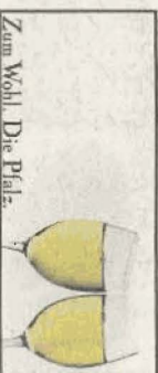
Logo der Palz Wein-Werbung.

Vier Weißweine werden erzeugt: Riesling, Müller-Thurgau, Morio Muskat und Gewürztraminer.